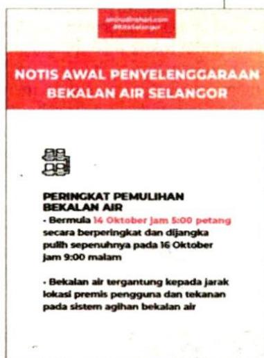
Notis yang dikeluarkan Air Selangor.

Pembelian air menerusi lori tangki air di empat stesen pengisian air setempat bagi pelanggan komersial turut disediakan manakala senarai 18 pili air awam dan stesen pengisian air boleh dirujuk di laman sesawang berkenaan.