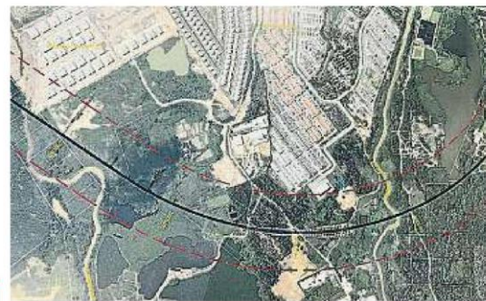
北线的初步路线有经过双文丹部分住宅区。(档案照)

根据州政府官方媒体《SelangorKini》于本月5日的报道，掌管雪州环境事务的行政议员许来贤证实已要求雪州水供管理机构(LUAS)、鹅唛县和乌雪县土地局、士拉央市议会和乌雪县议会正式提出反对。此外，许来贤也呼吁有可能受到影响的居民，表态反对北线。