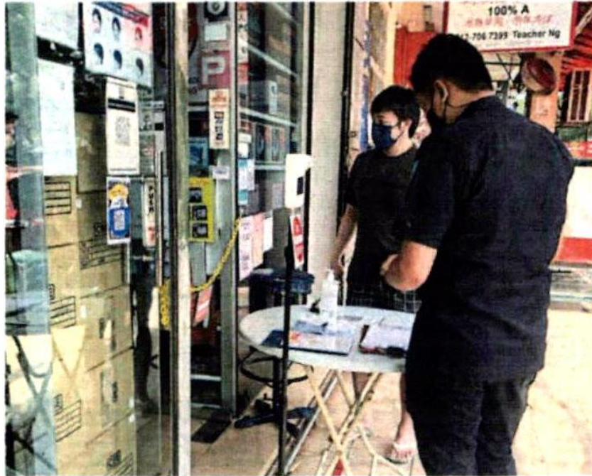
■ 执法员查商家是否遵守防疫SOP。